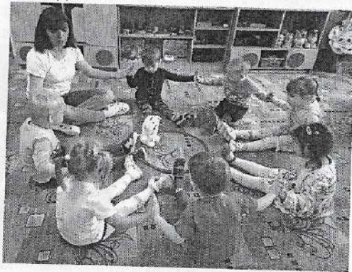
Структура утреннего круга следующая: